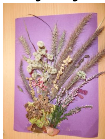
Praca Błażeja Wielgusa