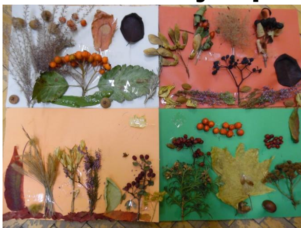
Prace z jesiennych darów