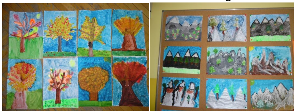
Jesienne drzewo i góry