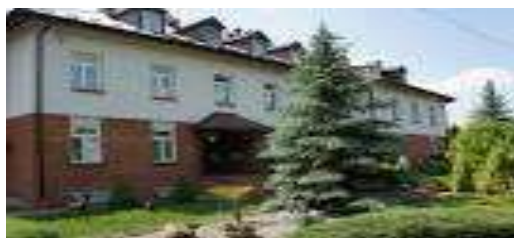
Dom Opieki Społecznej w Kiełczewicach

przedstawienie przygotowane na 11 listopada.