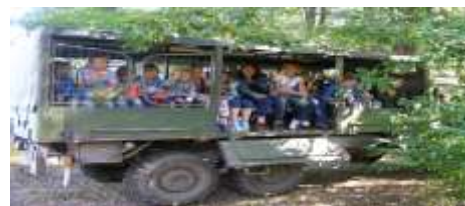
Uczestnicy Zielonej Szkoły

Następny dzień rozpoczęliśmy od jazdy konnej w stadninie „Karino”, oraz zabaw na świeżym powietrzu : strzelanie z łuku ; wyścigi na nartach wieloosobowych ; przeciąganie liny i skakanie przez nią ; wyścigi w czteroosobowych worko-spodniach ; gry z piłką. Po spacerze nad zalewem i wizycie w Skansenie Kolei Leśnej , powoli kończyła się nasza „zielona przygoda”. Wieczorem wróciliśmy do domów , a od poniedziałku do naszych codziennych obowiązków szkolnych .